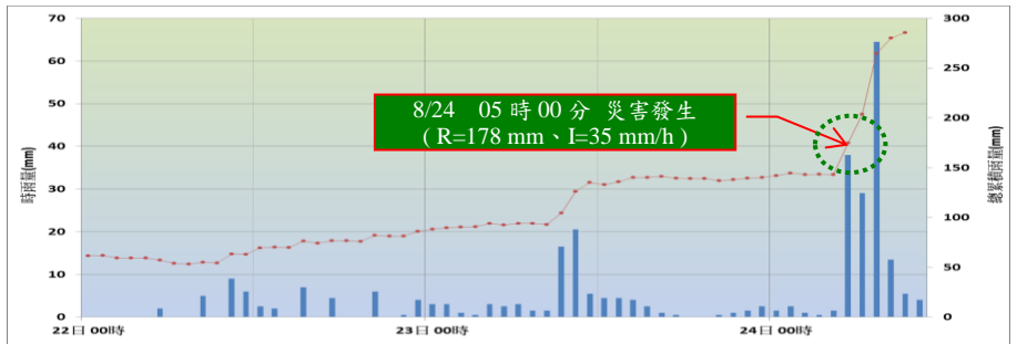
(參考雨量站：楓港(COR400) 土石流警戒基準值：無)