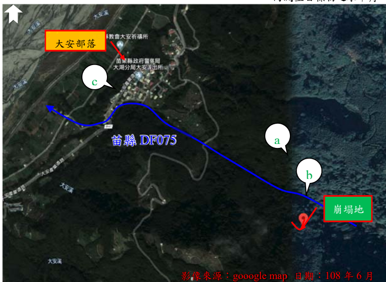
日期：108 年 6 月