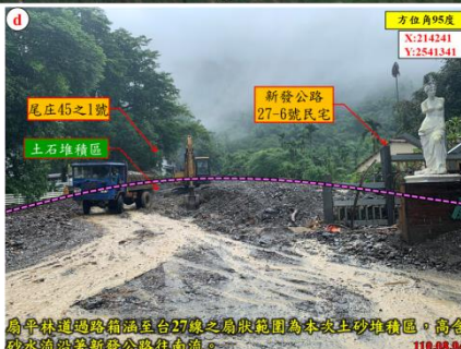
扇平林道過路箱涵至台 27 線之扇狀範圍為本次土砂堆積區，高含砂水流沿新發公路往南流。 110.08.04