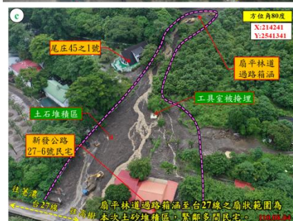
扇平林道過路箱涵至台 27 線之扇狀範圍為本次土砂堆積區，緊鄰多間民宅。 110.08.04