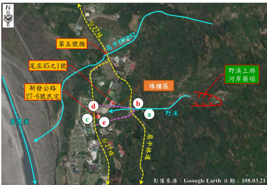
日期：108.03.21