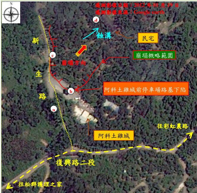
遙測影像日期：2012年08月29日