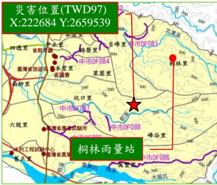
災害位置(TWD97) X:222684 Y:2659539