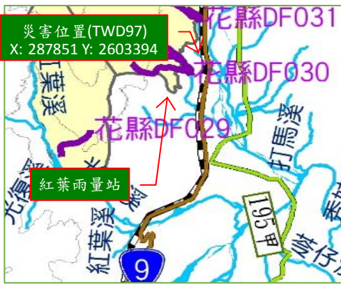
紅葉雨量站 降雨組體圖

7/23 00:00 土石流災害發生 (R=543.5mm、I=74.5mm/hr)