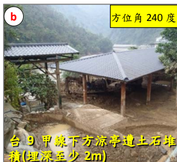
台 9 甲線下方涼亭遭土石堆積(埋深至少 2m)