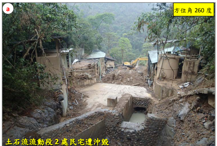
土石流流動段 2 處民宅遭沖毀