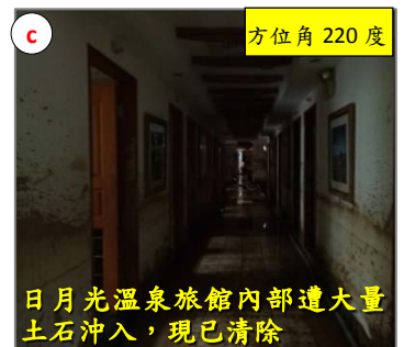
日月光溫泉旅館內部遭大量土石沖入，現已清除