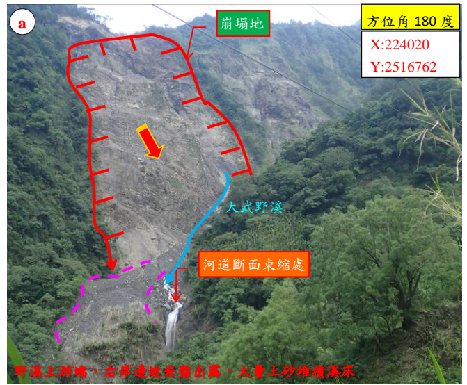
野溪上游端，右岸邊坡岩盤出露，大量土石堆積溪床