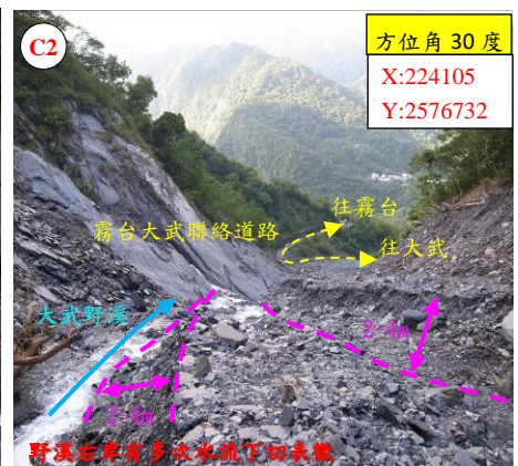
野溪右岸有多次水坑下切表態