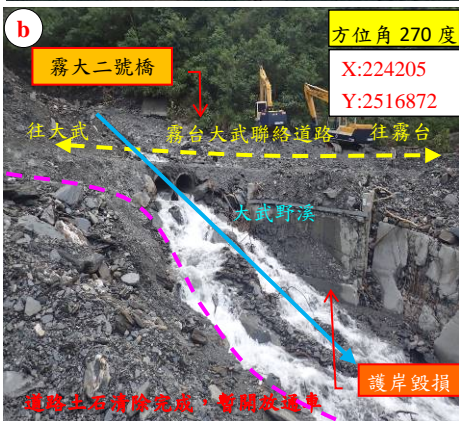
道路土石清除完成，暫緩恢復車