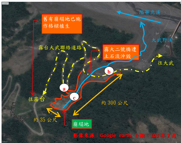
日期：103年7月