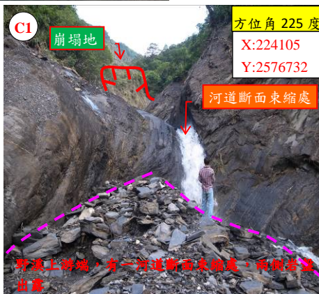
野溪上游端，有一河道斷面東縮處，兩側岩盤出露