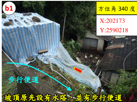
坡頂原先設有水塔，並有步行便道