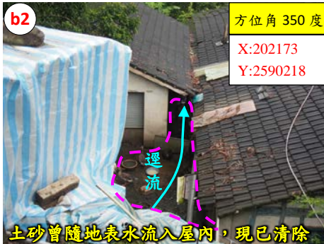
土砂曾隨地表水流入屋內，現已清除