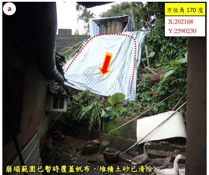
崩塌範圍已暫時覆蓋帆布，堆積土砂已清除