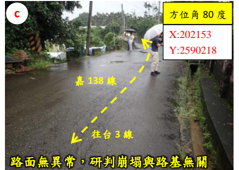
路面無異常，研判崩塌與路基無關