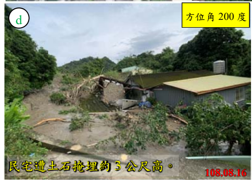
投縣 DF126 上游邊坡發生崩塌，土石滑落到下游，造成民宅遭掩埋。