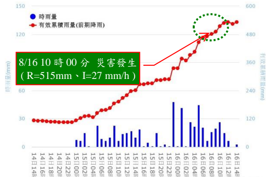
(參考雨量站: 六龜(COV800) 土石流警戒基準值: 350 mm)

108年0815豪雨-高雄六龜-001 ❖災害發生位置: 台27線13.5K ❖災害發生時間: 8月16日10時00分 ❖災害類型: 洪水 ❖累積雨量: 515 mm