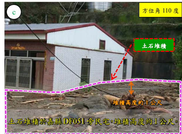
土石堆積於嘉縣 DF051 旁民宅，堆積高度約 1 公尺。