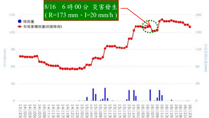
(參考雨量站：云水國小(81M69) 土石流警戒基準值：350 mm)