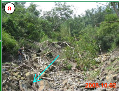
高雄A023右側支流中游河道現況