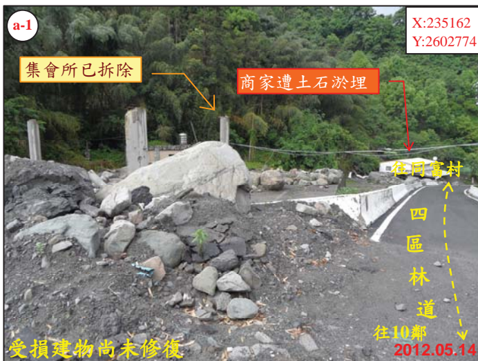
受損建物尚未修復