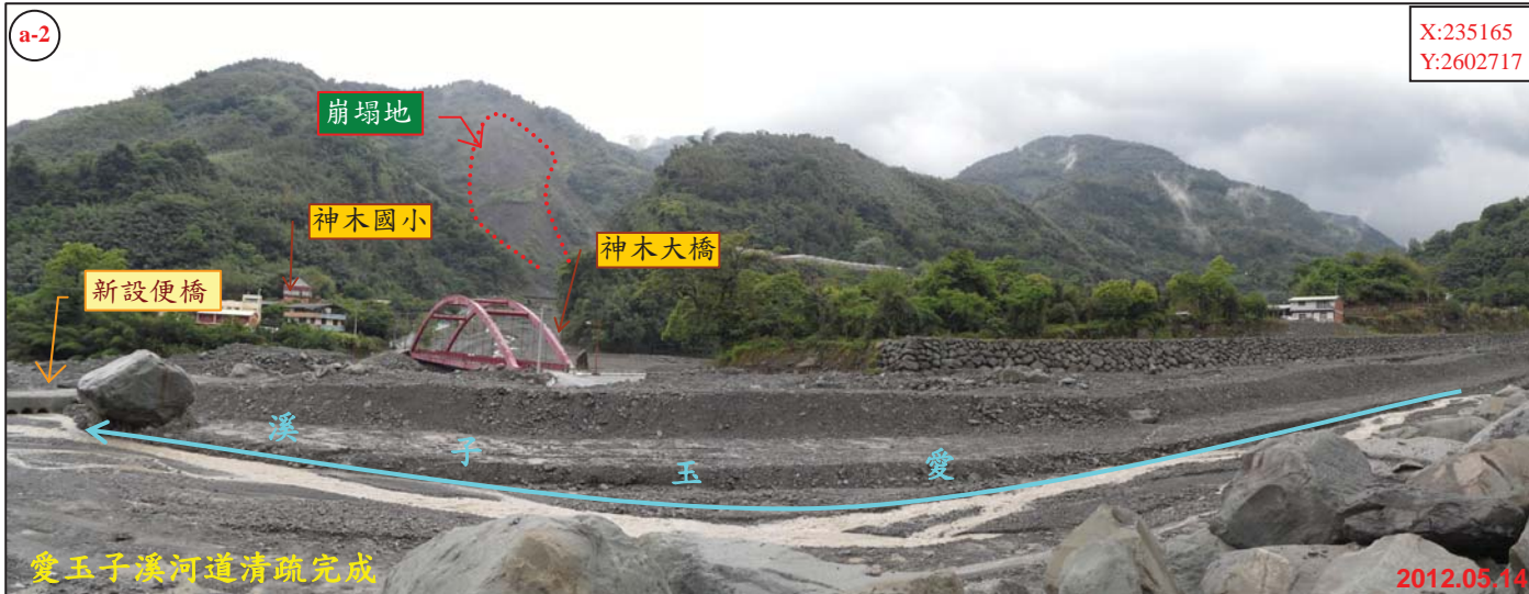
愛玉子溪河道清疏完成