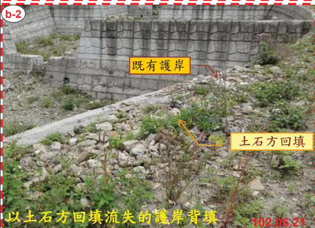
以土石方回填流失的護岸背填