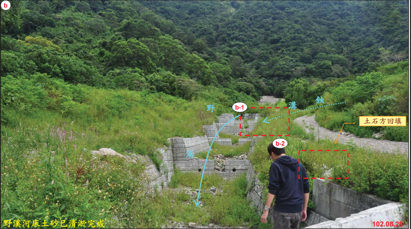
野溪河床土砂已清淤完成