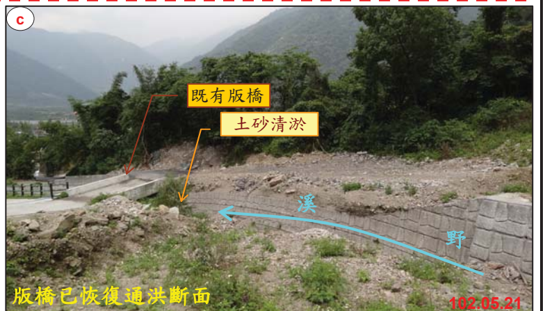
版橋已恢復通洪斷面