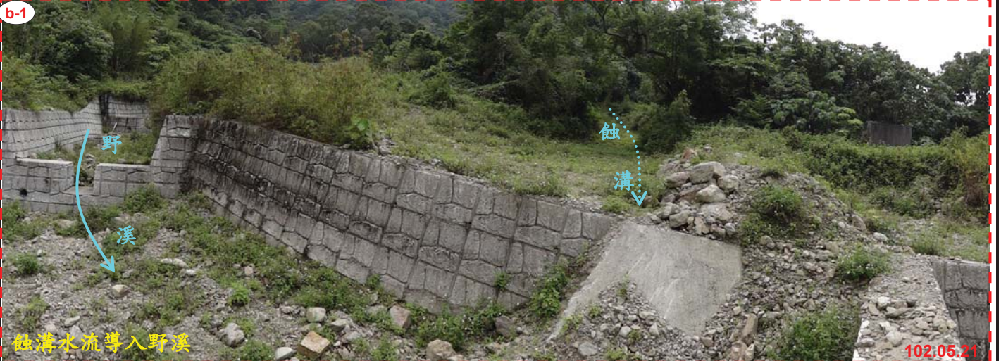
蝕溝水流導入野溪