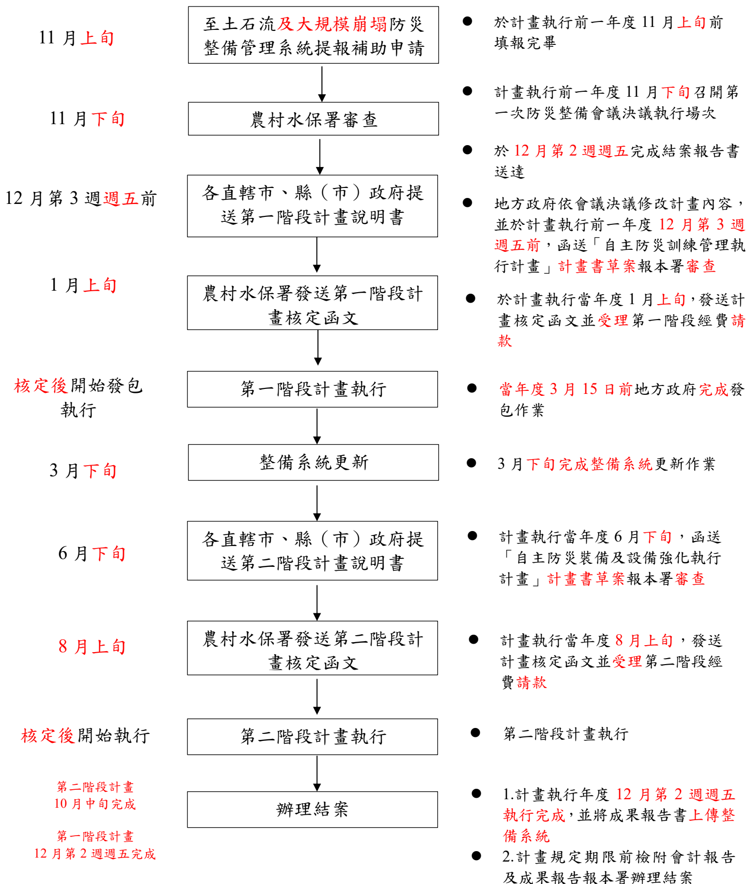
圖 2 農村水保署自主防災社區 2.0 推動計畫流程圖