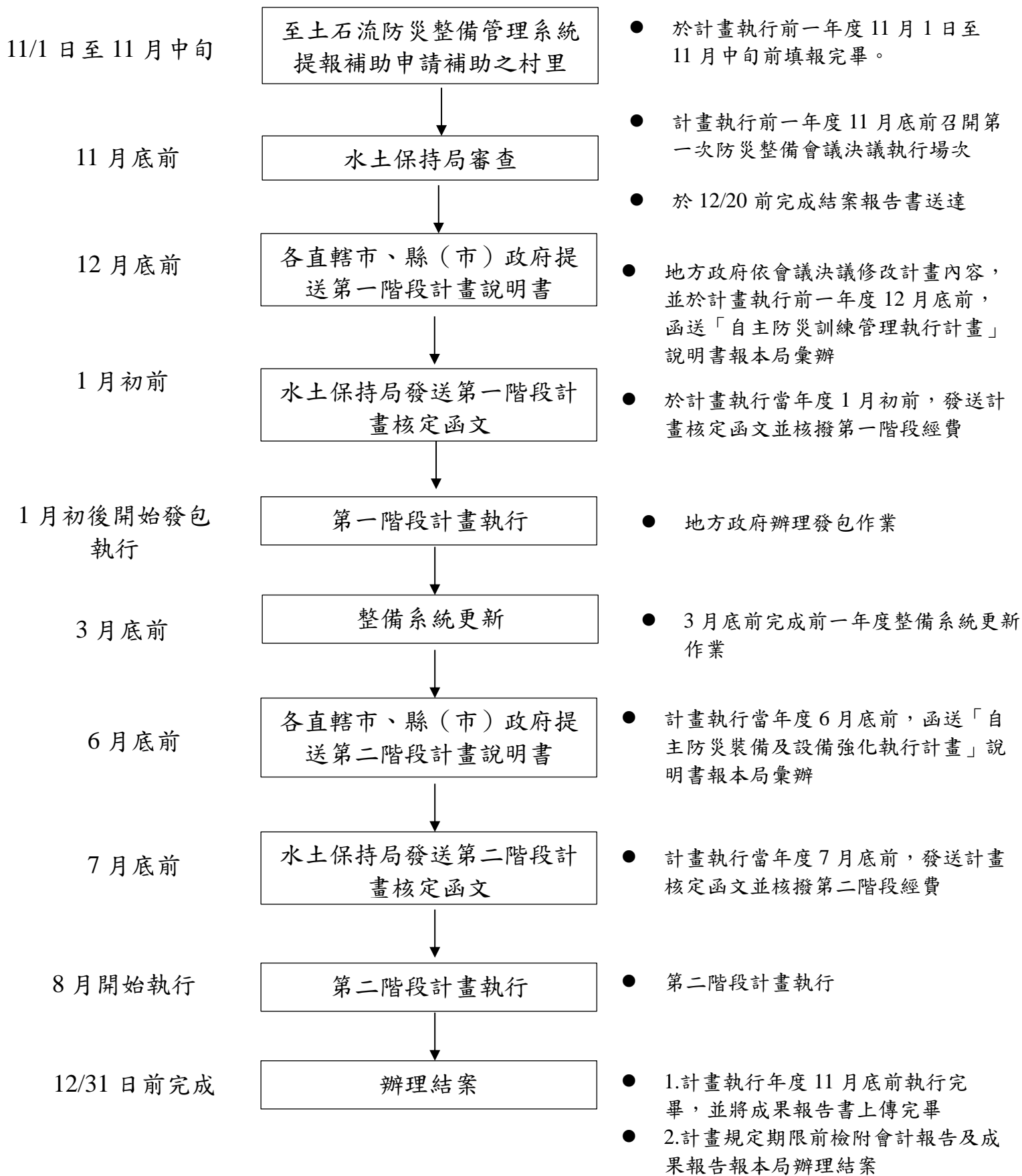
圖 2 水土保持局自主防災社區 2.0 推動計畫流程圖