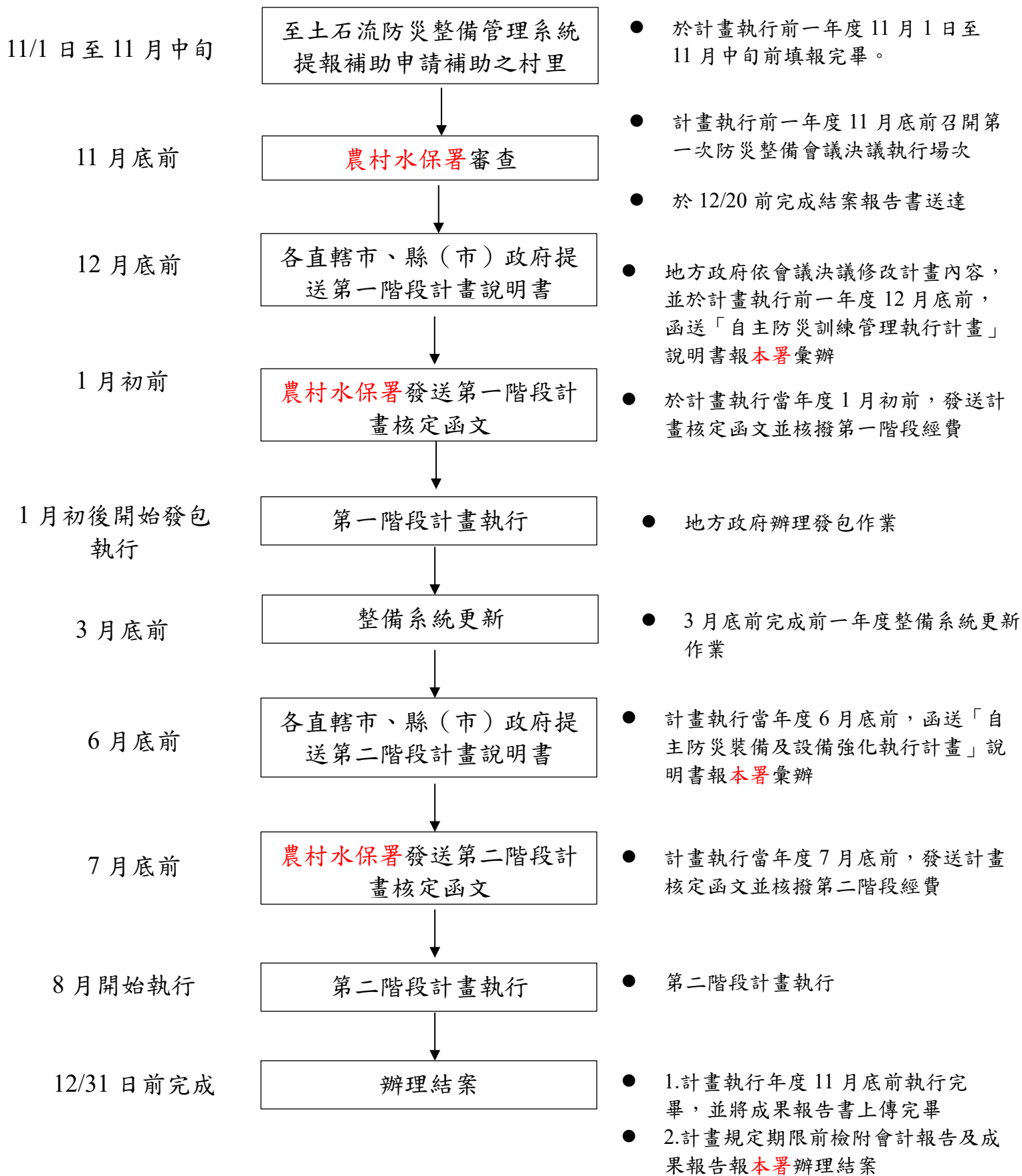
圖 2 農村水保署自主防災社區 2.0 推動計畫流程圖